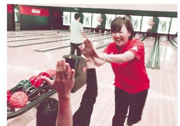
▲お客さまとのボウリングの様子

現在は出張所長としてメンバー7名と一緒に毎日を過ごしていますが、その多くは20代前半で、子どもがいる働くママもいます。今後も、お客さま本位の仕事を常に心がけ、活気あふれる出張所運営を行い、組織拡大を目標にキラキラ輝く SumitomoLife を送ってまいります。