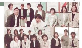
▲徳山営業所各拠点メンバー

換会は、今でも継続しており、職場のコミュニケーションをはかる貴重な時間となっています。育児短時間勤務・育孫短時間勤務・育児休業を取得した社員も、さらにパワーアップして職場に復帰し、元気いっぱい活動しています。