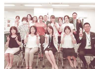
▲職場のみなさん (注)撮影時のみマスクを外しています

生命保険営業は、人生の「辛い」「悲しい」経験が必ず活かせる仕事です。私には、ワーク・ライフ・バランスを保ちながら、人の役に立てるこの仕事が大好きです。これからも、給付金や保険金のお届けまでお客さまに寄り添える生命保険営業をめざします。最近では、趣味の御朱印集めを話題の一つにして、お客さまとコミュニケーションをはかっています。