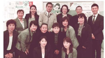
▲一致団結して業務に取り組む小牧分会のみなさん

従来の共済保険販売だけでは難しかった白地法人開拓に、新人も含めて積極的に取り組んでいます。中小企業の福利厚生のお手伝いができるということが、仕事に対する使命感と満足感につながっています。これからも長くこの仕事に携わっていけたら幸せです。